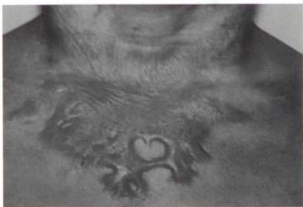
před aplikací Sil-k